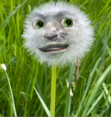
Die Botschaft eines Kindes, ein sogenannter 'Speakr'