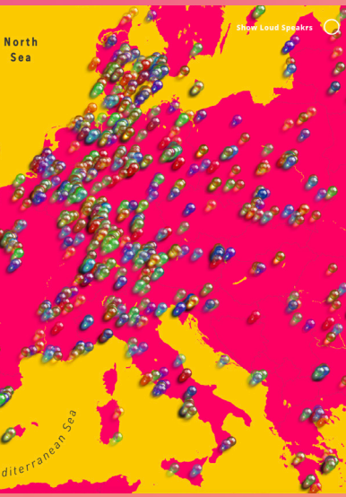
Beteiligung an Earth Speakr in ganz Europa